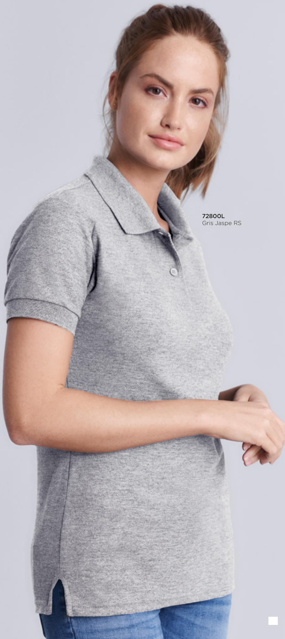
72800L Gris Jaspe RS

^ Verde Seguridad está certificado con ANSI/ISEA 107 estándares de alta visibilidad.